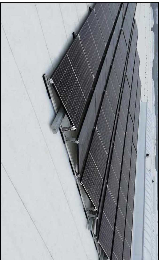
FVE PANELY VÝCHOD–ZÁPAD, SKLON 10°